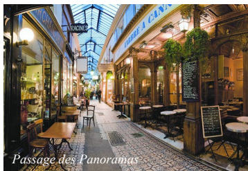
Passage des Panoramas

Passage des Panoramas, Galerie Vivienne, Passage Jouffroy, Passage du Grand Cerf... Ces lieux vous disent peut-être quelque chose. Construites pour l'essentiel dans la 1 ère moitié du XIX ème siècle (Paris a compté plus de 150 passages couverts), ces voies ont été tracées et percées au milieu des immeubles. Couvertes par des verrières, elles présentent un éclairage zénithal et une lumière très caractéristique. Ces passages couverts proposaient des commerces variés destinés à une clientèle aisée, à l'abri des intempéries. Les grandes avenues ouvertes par le Baron Haussmann, mais aussi l'ouverture des Grands